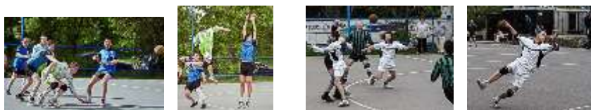
Draken – Ostopovice