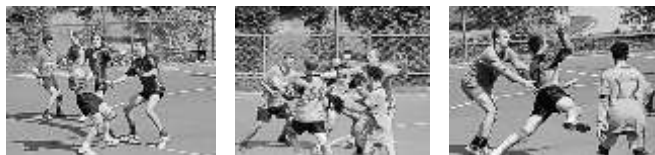
Draken proti Jihlavě.