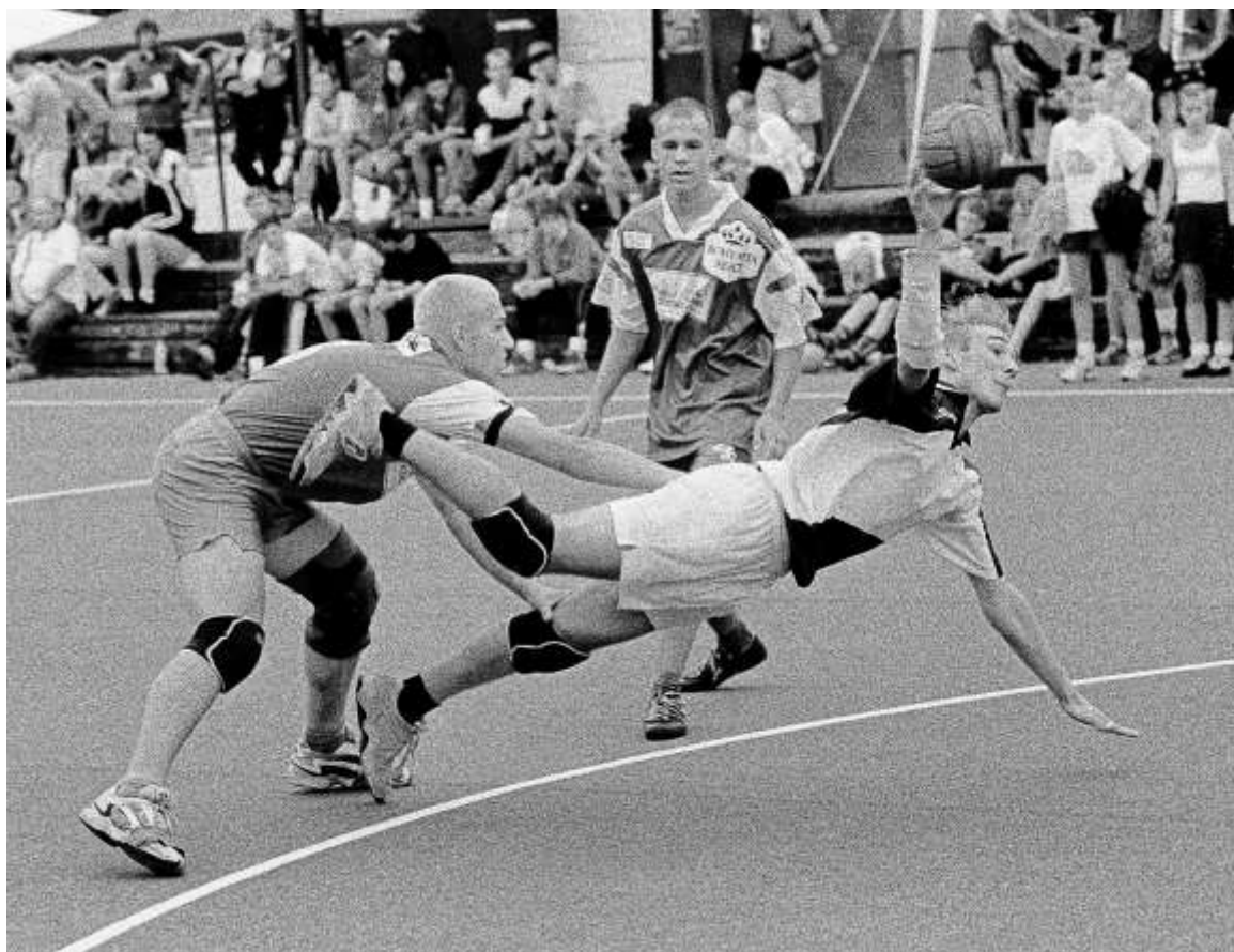
Kopec proti Nýřanùm