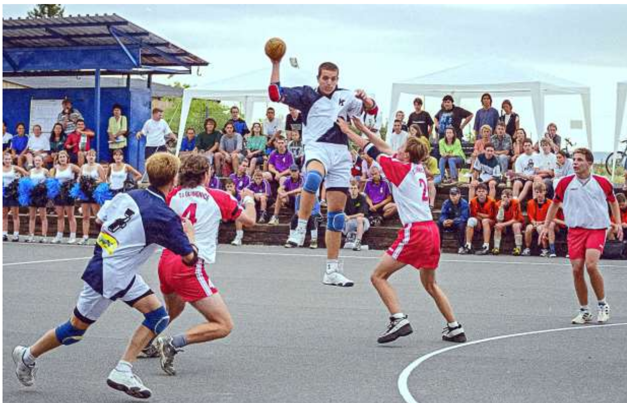
Draken - Dluhonice

Zápasy ostatních družstev v úvodním dnu potvrdily papírové předpoklady a nic nebylo rozhodnuto. Dva velcí favorité vzájemně remízovali a ostatní je nejspíš neohrozí. Pokud žádný z obou favoritů v dalším průběhu nezaváhá a všechny další zápasy vyhraje, mistra určí lepší skóre. Na ostatní zbude boj o bronzovou medaili.