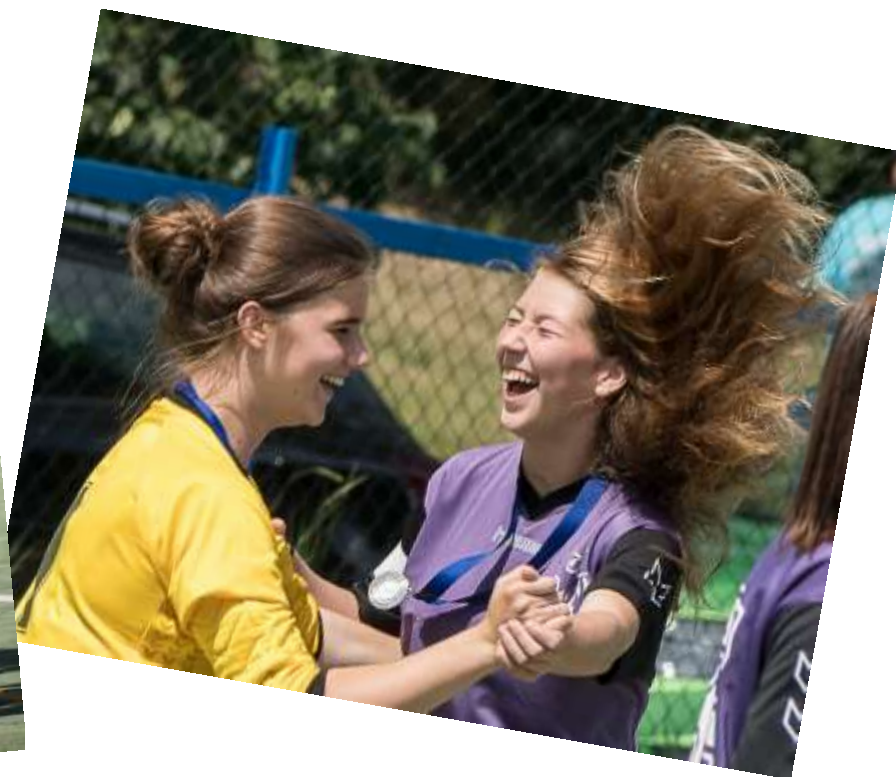
Medaile doprovázel i vítězný tanec (2018)