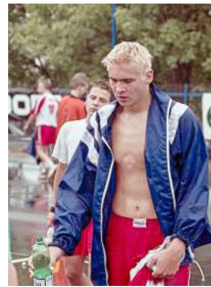
Smutek Dluhonickeho Horáka, budoucí hvězdy německé házenkářské bundesligy

Nýřany se tak svojí obětavou hrou postaraly o největší překvapení celého mistrovství, vybojovaly si zaslouženě třetí místo a sebraly titul Dluhonicím. Radovali se domácí Drakeni, kterým titul spadl do klína na poslední chvíli. Přestože se zdálo se, že o titulu rozhodl již první zápas šampionátu, drama nakonec trvalo až do závěru a teprve poslední zápas určil mistra republiky pro rok 2000.