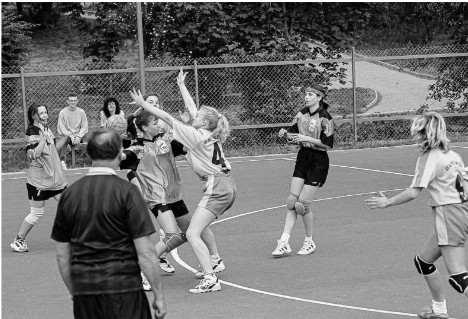
Dorostenky v zápase Draken – Jihlava (2000)