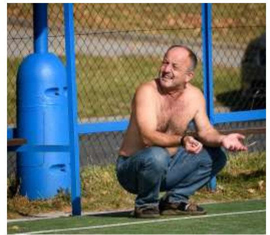
3. Divit se, že to šlo!