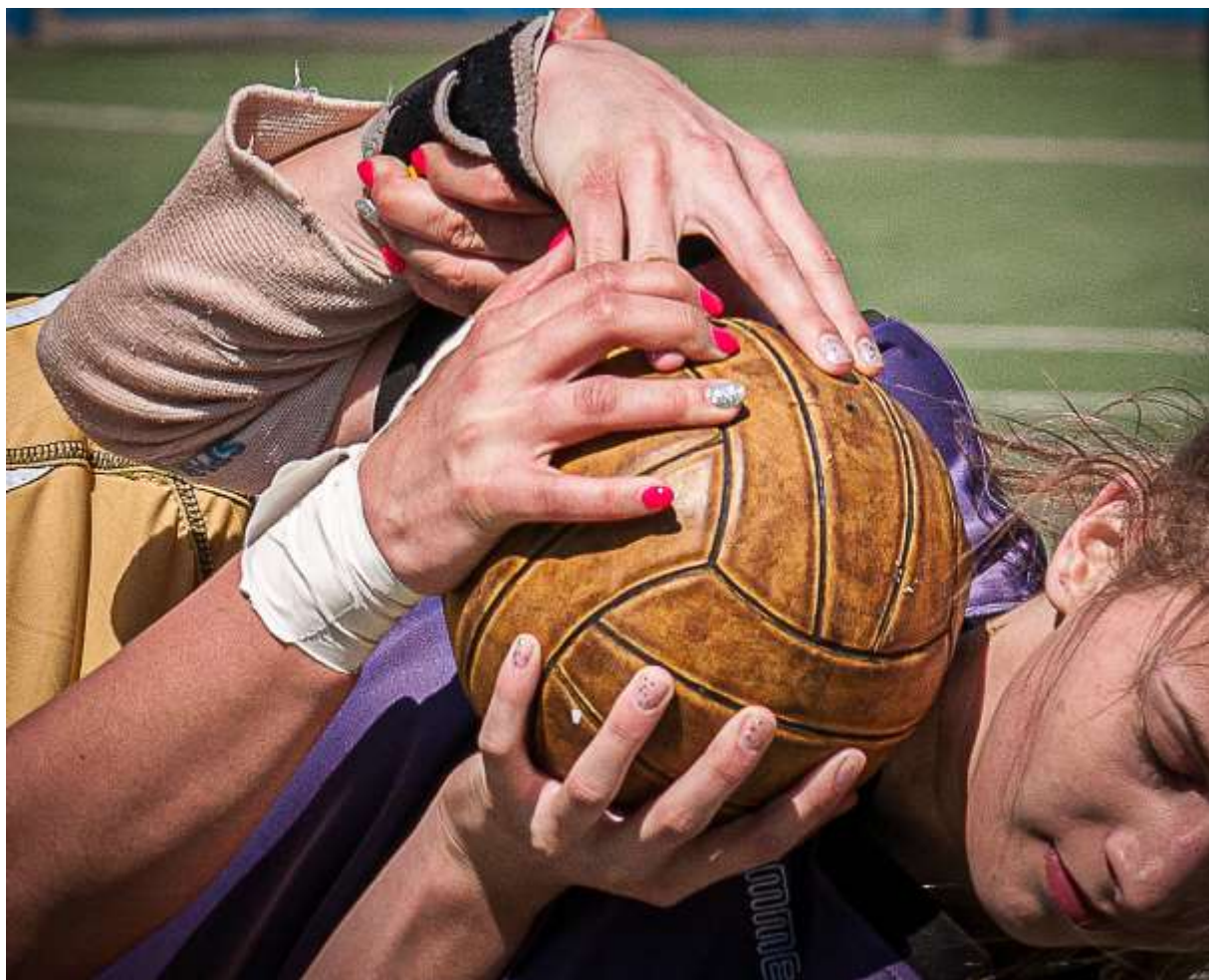
Na hřiště jen s perfektně upravenou manikúrou