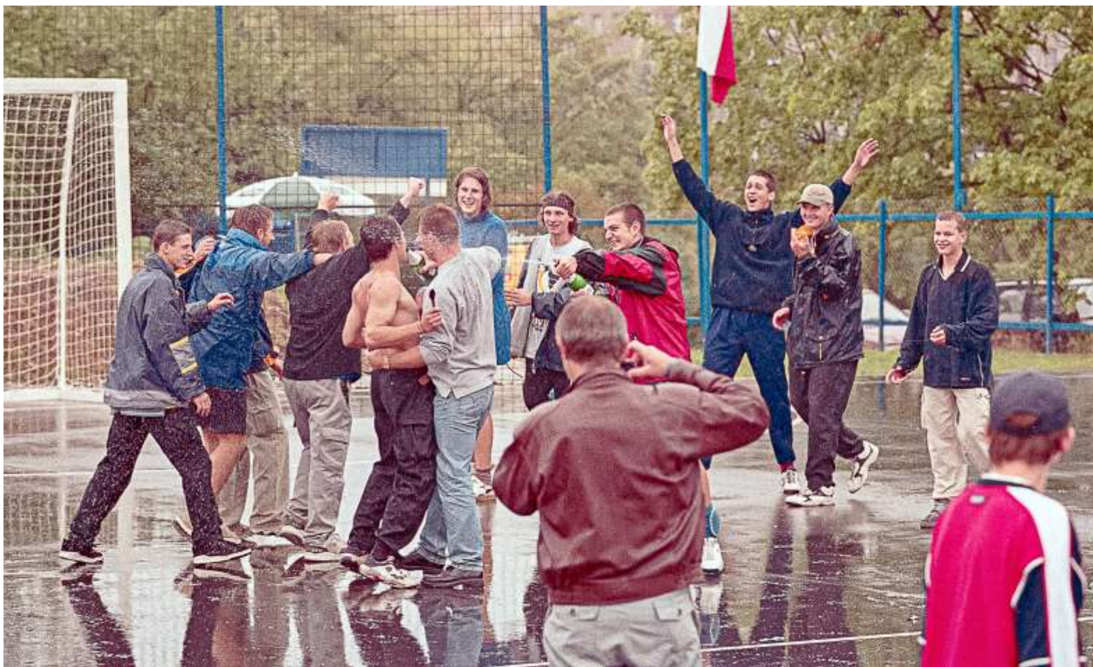
Jury ještě počítá výsledky a píše diplomy, ale Draken už zahájil bouřlivé oslavy