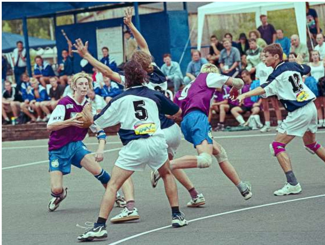
Draken - Nýřany

Nikdo nepochyboval, že Draken i Dluhonice porazí všechny ostatní soupeře. Po úvodní remíze favoritů bylo jasné, že nestačí jen vyhrávat, musí vyhrát o hodně. Už první sobotní zápasy Dluhonic ukázaly, že vyhlídky Drakenu na získání mistrovského titulu se ztrácejí zápas od zápasu. Dluhonice své soupeře drtily výraznými gólovými rozdíly, zatímco útočníci Drakenu po skvělém prvním zápase začali opět trefovat tyče a břevna.