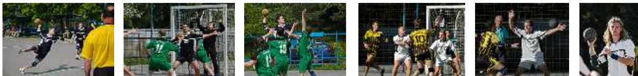
Draken proti Novému Městu n/Metují