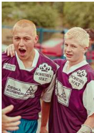
Další strůjci výhry Nýřan nad Dluhonicemi, obránce zvaný Šedý vlk (vlevo)