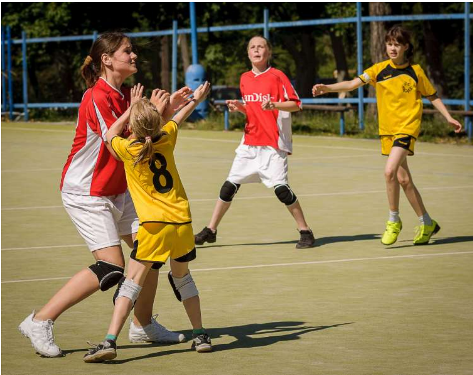
Malá, zato rychlá