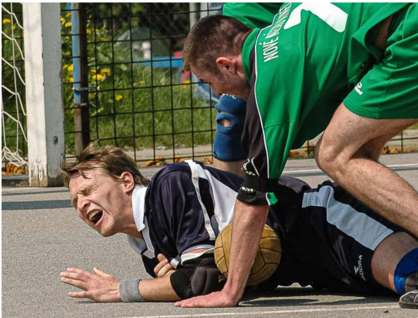
To byl na Drakenu ještě asfalt