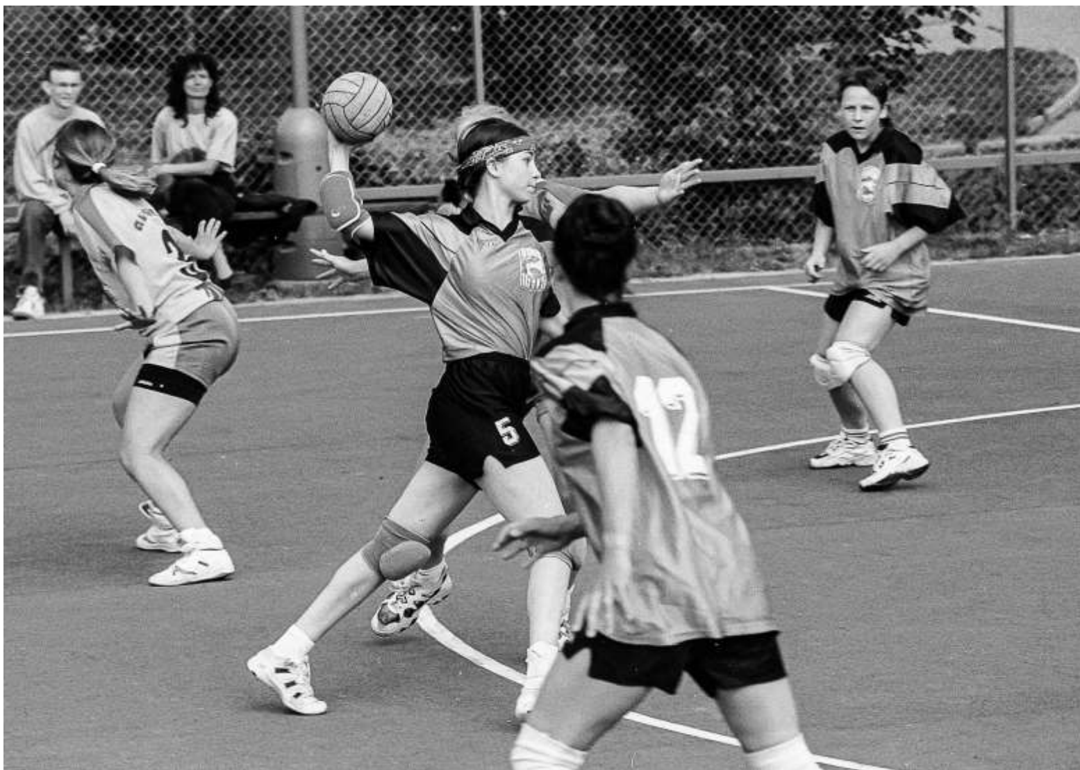
Dorostenky v zápase Draken – Jihlava (2000)