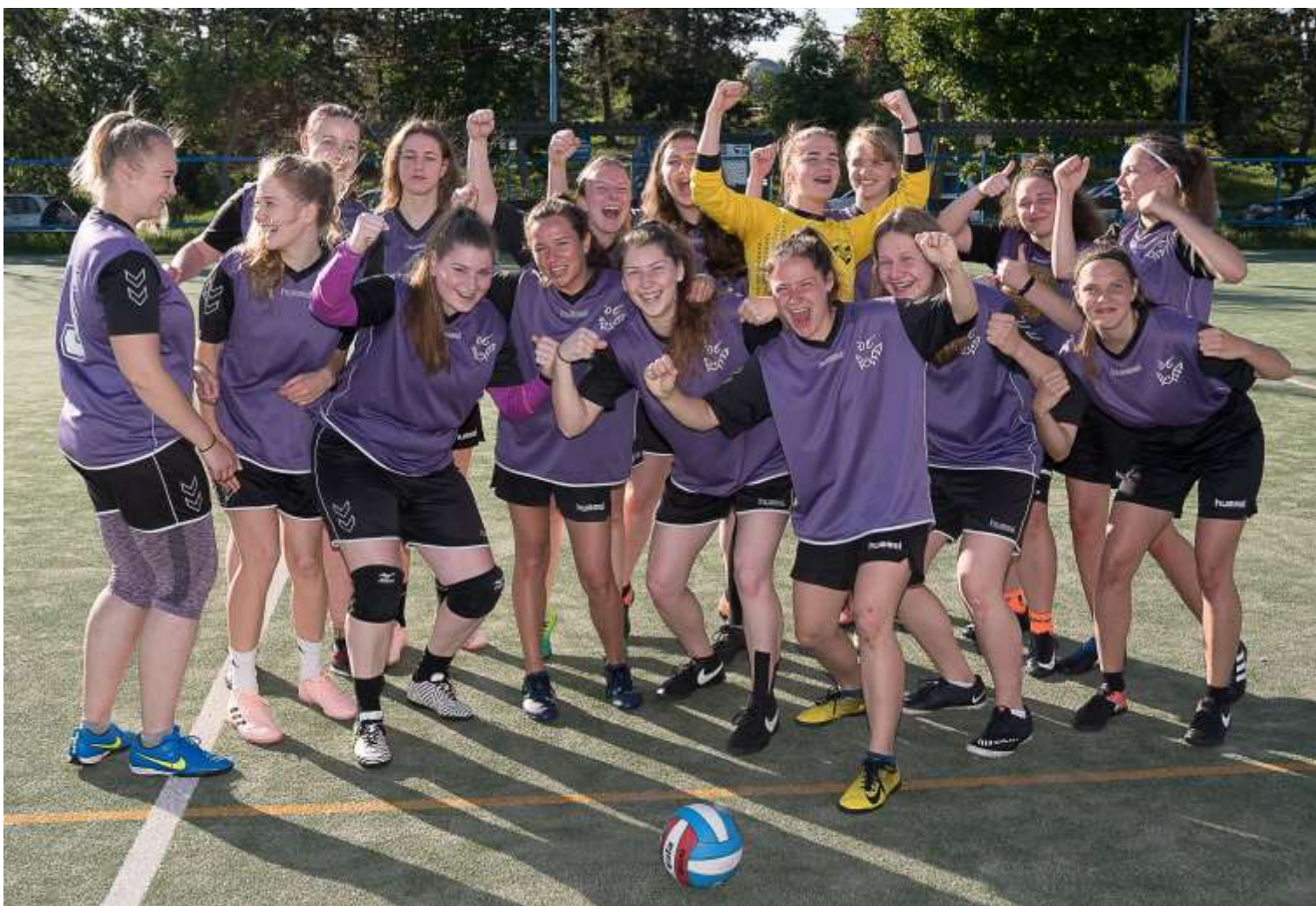
2020 – už mezi ženami