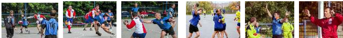
Draken proti Moravské Slávii.