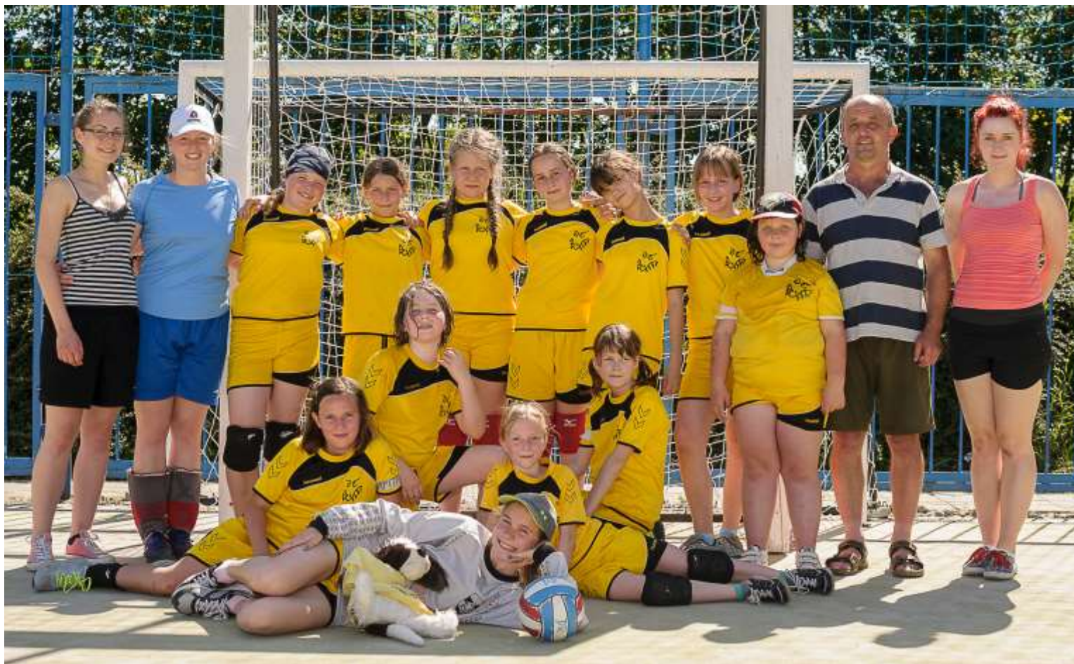
Mladší žákyně v roce 2014. Dnes už hrají za ženy A