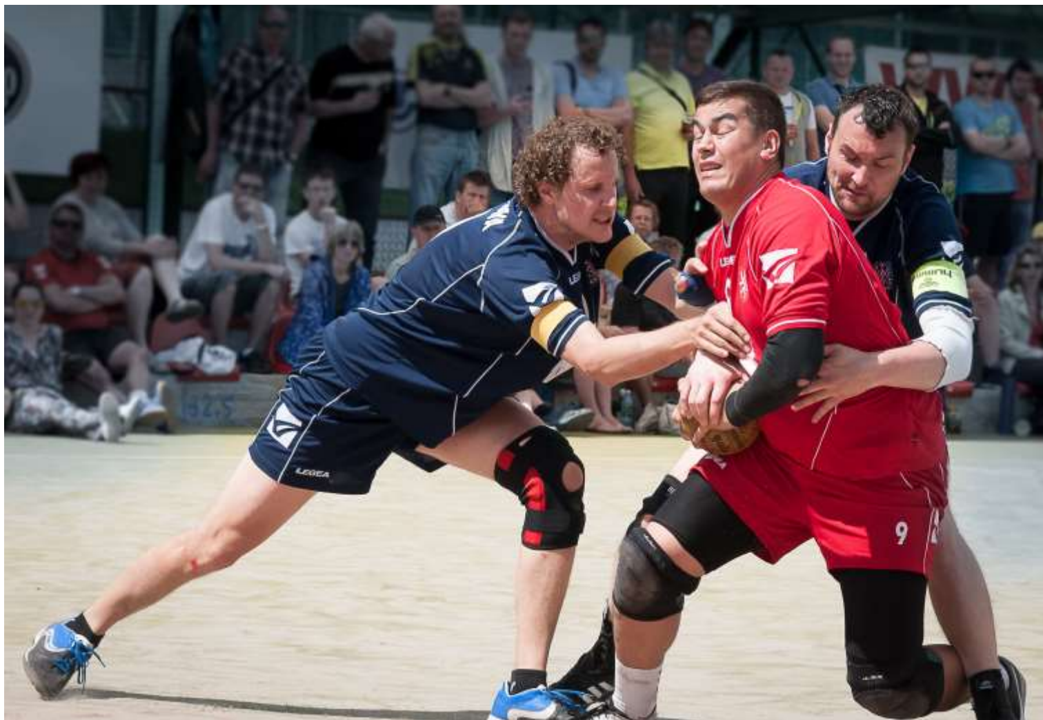
Zápas Čechy - Morava