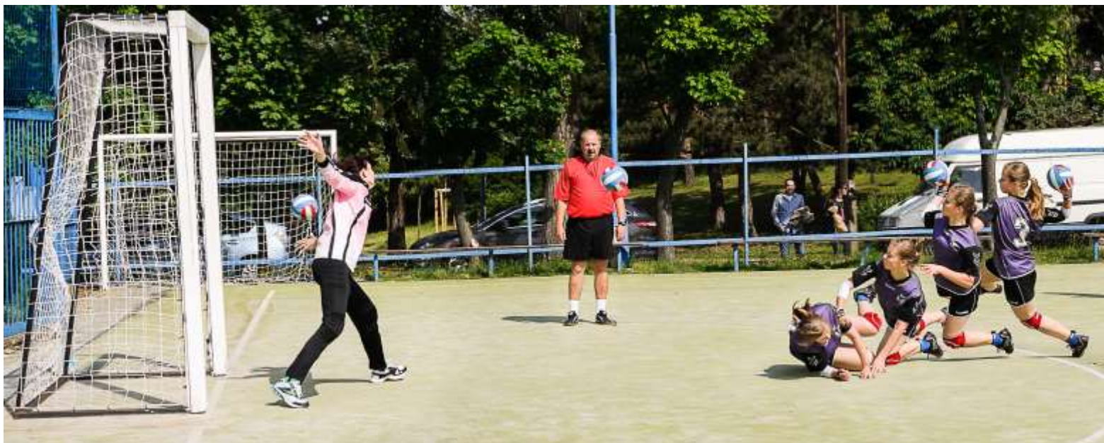
Brankářka neměla šanci, balón visí v síti (sekvence s intervalem 1/10 sekundy)