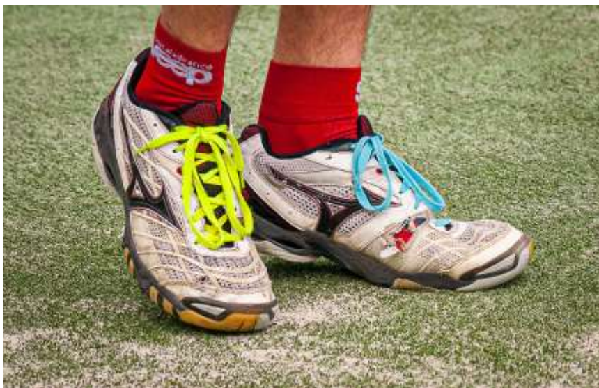
Hráč zjevně nepodepsal tu správnou reklamní smlouvu. Nové tkaničky to nespraví.