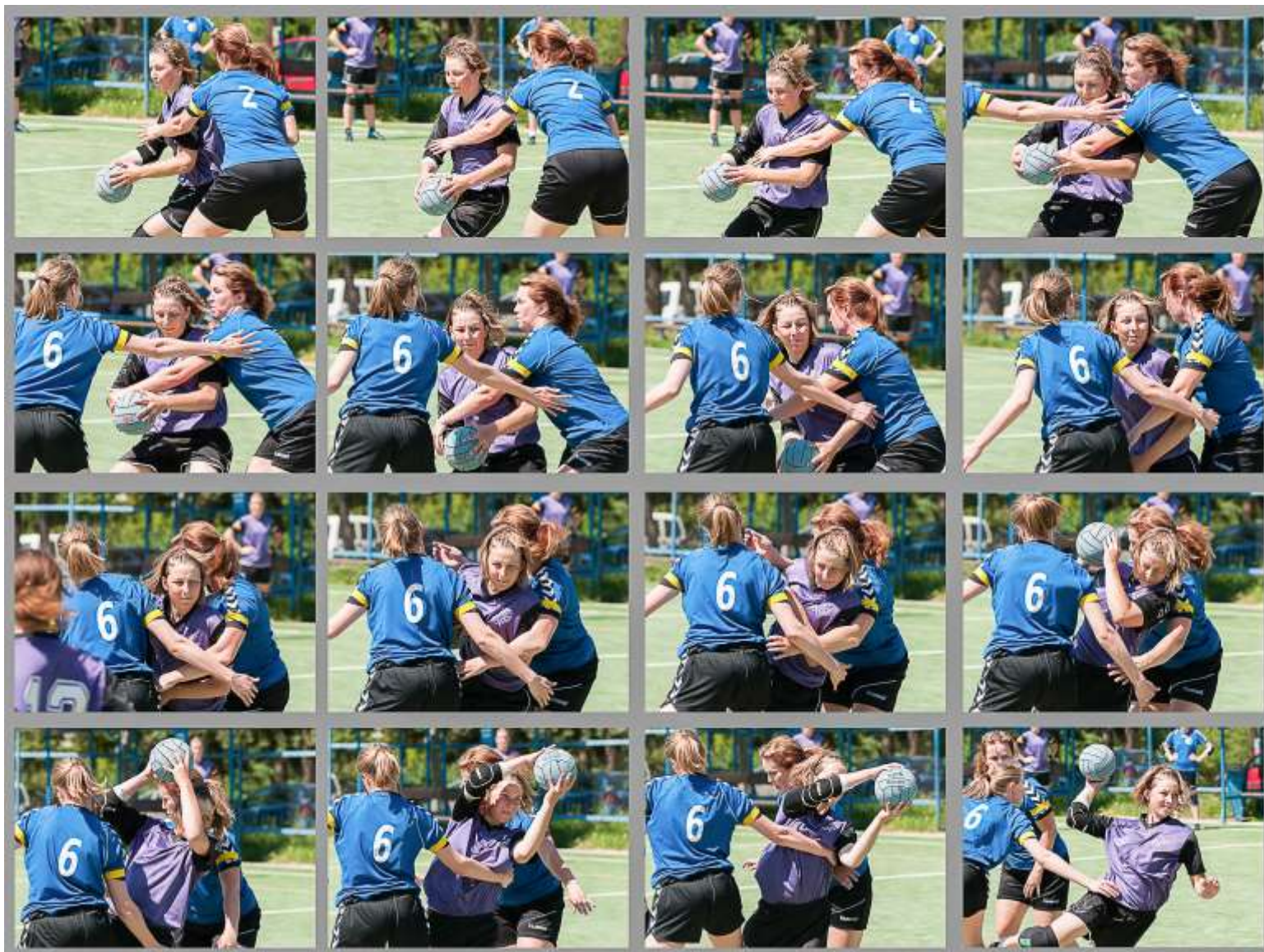
Dvě na jednu, zato šikovou (rozfázování průniku, interval snímků 1/10 sekundy)