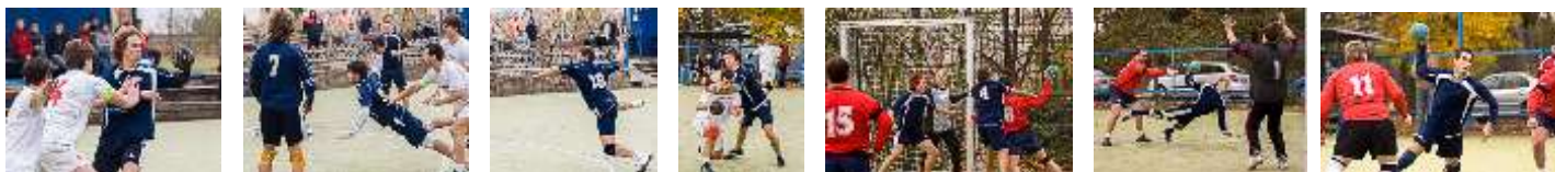
Draken proti 1.NH Brno B.