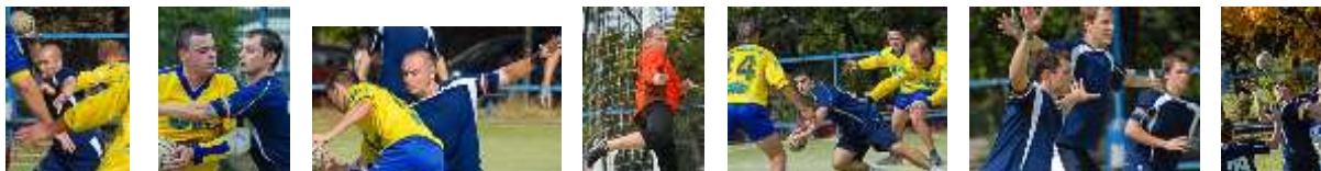
Draken – Jihlava