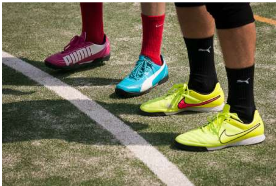
Červené ponožky k fialové botě, no fuj! Zase mu neplete pravá a levá bota ....