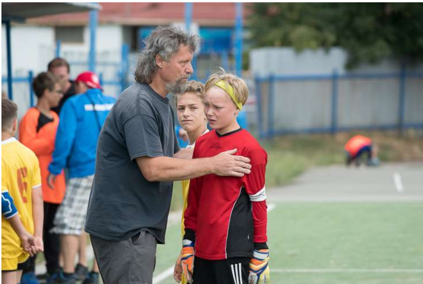
Někdy je třeba přísnost, jindy zase psychologie