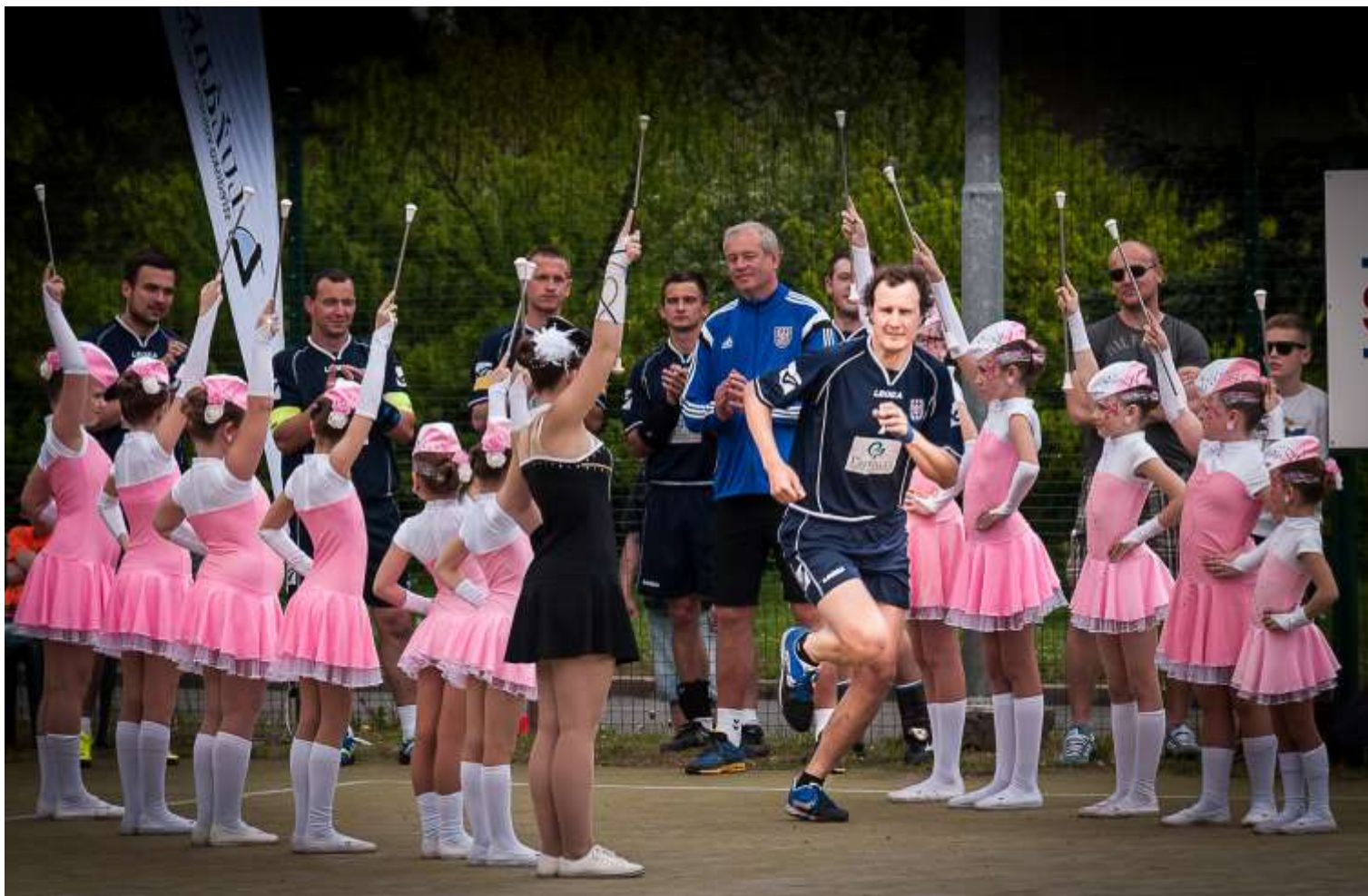
Botis vbíhá na hřiště v zápase Čechy versus Morava